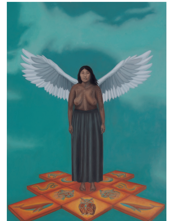
"Transformación II" óleo sobre tela, año 2025 110 x 80 cm.