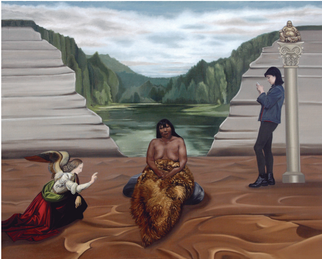
“La madre de todos los tiempos” óleo sobre tela, año 2019 137 x 110 cm.