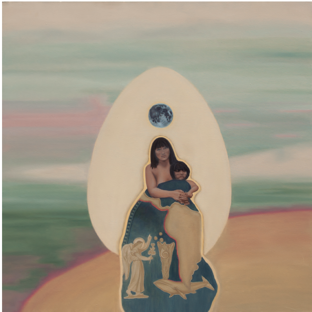
“Madre Original I” óleo sobre tela, año 2025 110 x 110 cm.