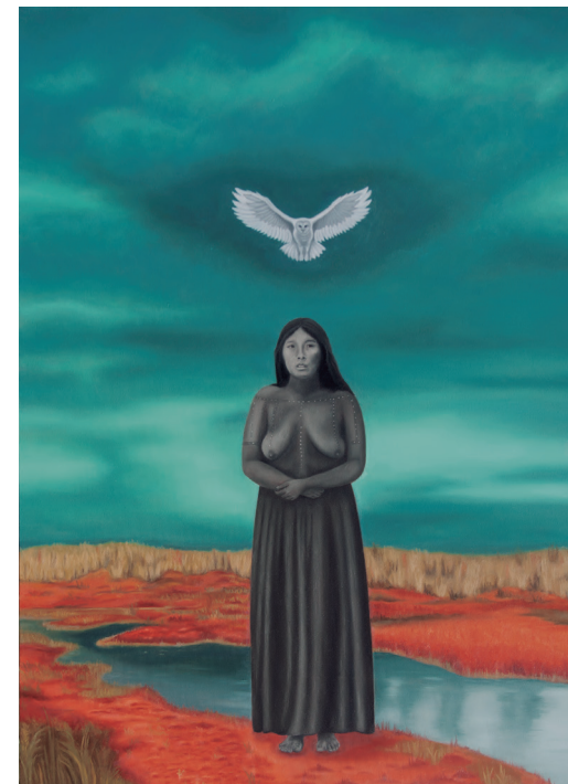
"Transformación I" óleo sobre tela, año 2025 110 x 80 cm.

1993 / Participa en la ejecución de la pintura mural "Ñuble: Luz, greda y canto". Estación de Ferrocarriles del Estado, Chillán. financiado por el FONDART.