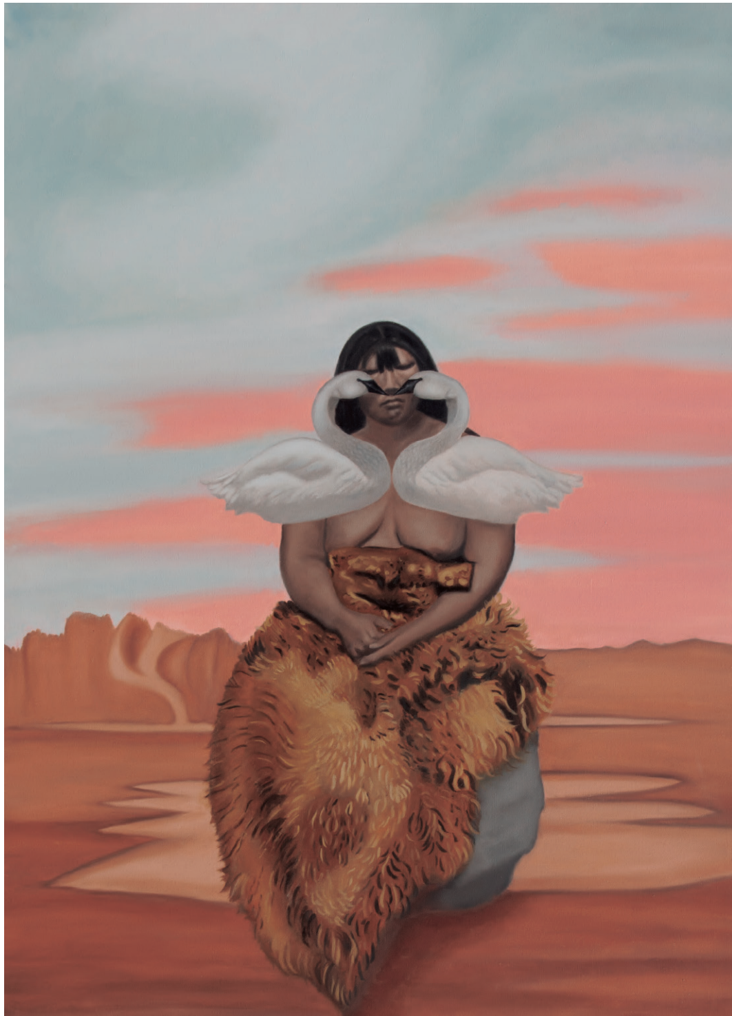
“Mujer con Cisnes I” óleo sobre tela, año 2025 110 x 80 cm.