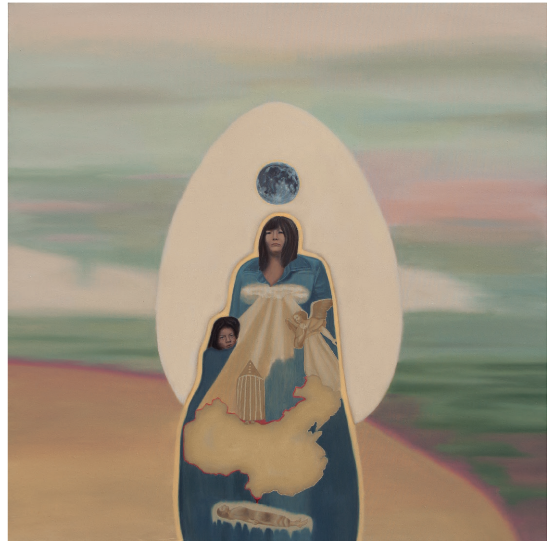
“Madre Original II” óleo sobre tela, año 2025 110 x 110 cm.