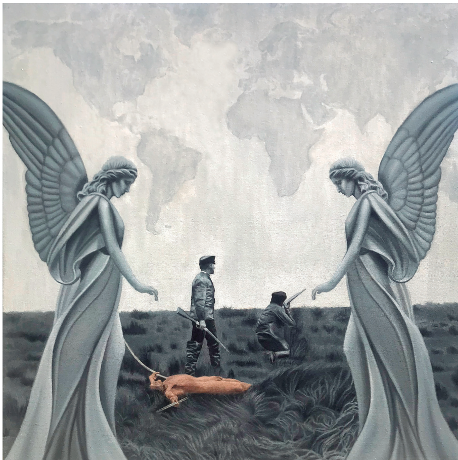
“Genocidio Selk'nam” óleo sobre tela, año 2024 80 x 80 cm.

Habitaron el territorio magallánico por unos 10.000 años, hasta que fueron diezmados por la colonización ganadera ovina a partir de 1886 . La congregación salesiana intentó protegerlos trasladándolos a la isla Dawson, donde muchos murieron a causa de enfermedades, mientras que otros fueron desarraigados y explotados. A lo largo del territorio, empezando por Punta Arenas , fueron llevados a estancias para trabajar como servidumbre, padeciendo graves abusos, entre ellos violaciones a mujeres y niñas. Algunos llegaron hasta las salitreras para laborar en ellas, y otros aún más lejos, siendo exhibidos como rarezas en ferias de París, Londres y Bruselas .